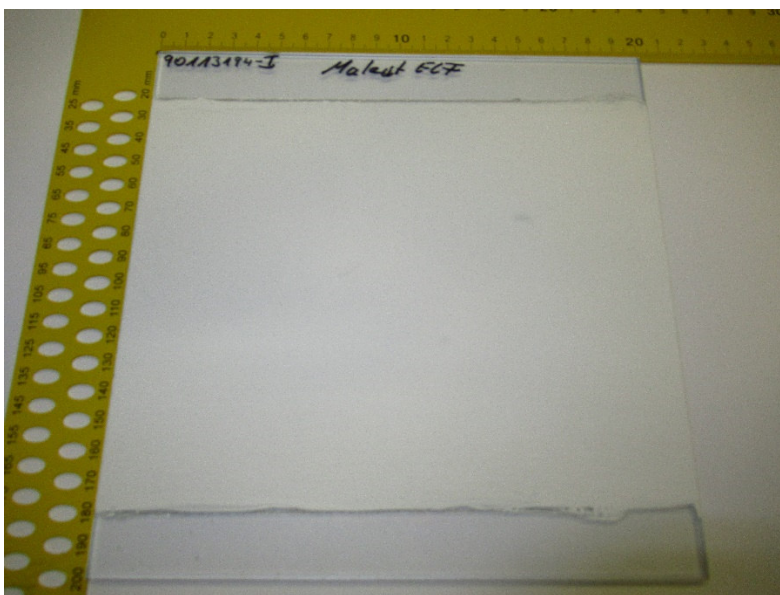
Abbildung 1: Prüfkörper